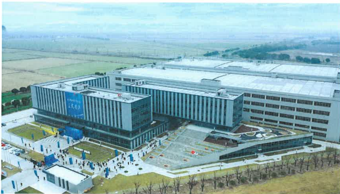
图1：德沃康科技集团有限公司工厂实景

公司根据市场细分，不断优化产品结构及工艺技术，在保持智能家具应用市场的同时，逐步占领医疗护理及智能办公市场，市场占有率逐步上升。同时，公司有着完善的营销网络，在全球20多个国家建立起全球售后服务体系，为客户提供更全面的标准化服务和深度定制服务。