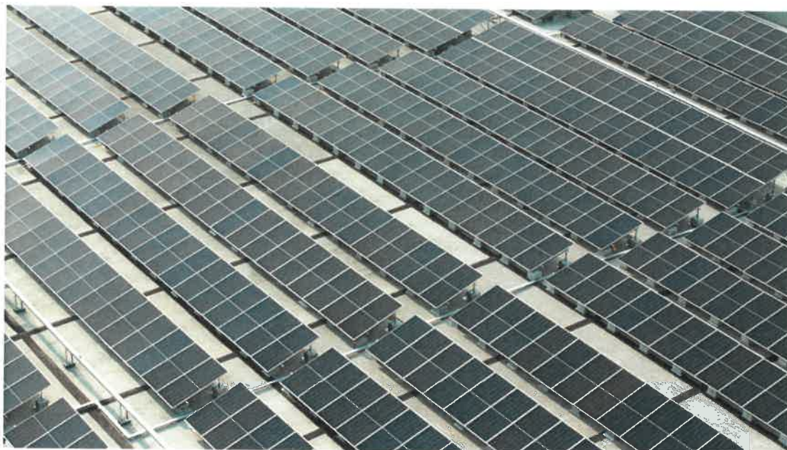
图13：光伏项目实景图

公司于2022年10月导入能源体系，以“低碳环保、清洁循环、节约增效、绿色家居”的能源方针，于2023年9月获得ISO50001体系认证，同时公司利用房屋屋顶面积约20000平方米，建造分布式光伏发电项目，总装机容量约2MW，由4个光伏发电子系统组成(单个子系统不大于600kWp)，每个光伏发电子系统由若干个光伏发电单元组成；每个光伏发电单元由若干个光伏组件阵列和单台组串式逆变器组成，并网电压等级380V，项目总投资近600万元，项目委托浙江涵普电力科技有限公司负责施工，于2023年11月开工建设，于2023年12月底完工，项目建设后经过第三方节能评估的节能量：预计年太阳能光伏发电量216.0万kWh，折合标煤613.4tce，年创造经济价值约184万元，相当于降低了1133.136吨CO 2 排放，达到低碳环保目的，实现了企业在节能减排上的责任担当。