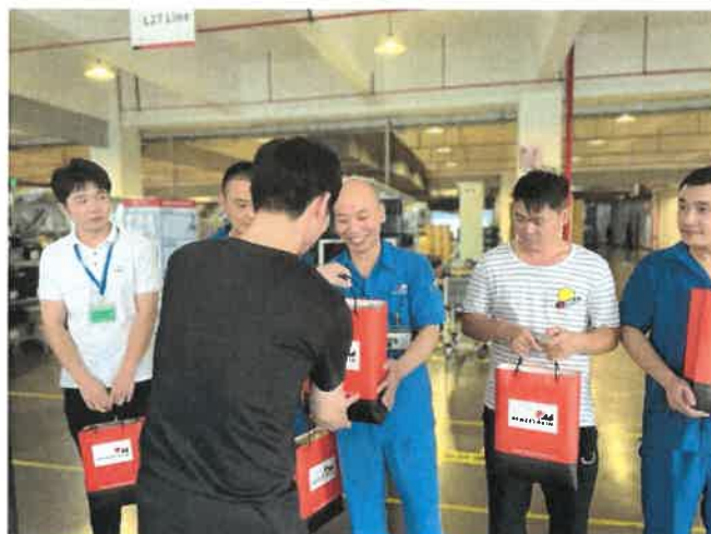
图6：建军节慰问公司退伍军人

（四）公司具备完善的职业健康体系，对相关员工按照规定进行岗前、岗中、岗后体检，同时，公司对相关工作场所的环境因素和危险源进行识别，为各岗位员工配备耳塞、口罩、眼罩等相应劳保用品。根据厂区内实际情况，公司邀请消防、应急相关部门来我司开展消防、安全等演练指导。2023年新工厂