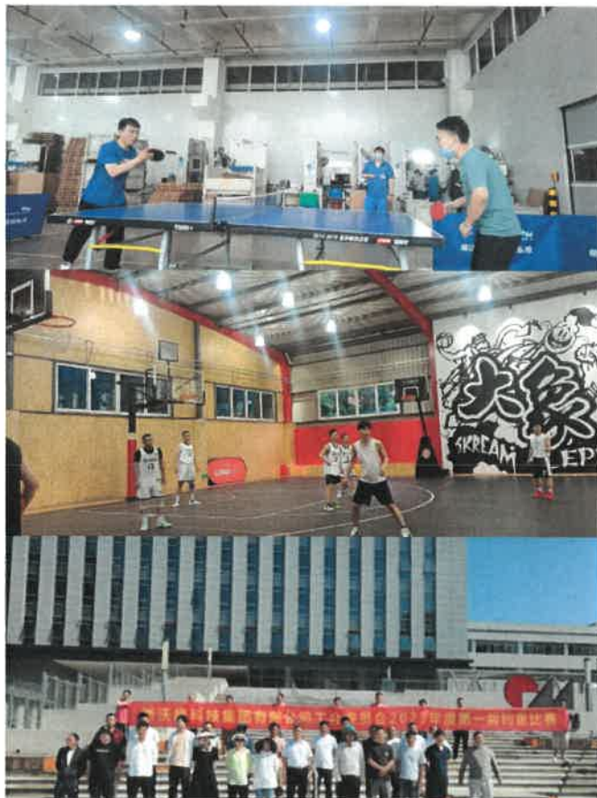
图5：德沃康乒乓球比赛、篮球比赛、钓鱼比赛