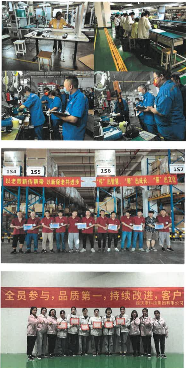
图3：2023年各车间劳动技能竞赛

劳动和各种形式的奖励挂钩，起到了有效的激励作用。只有不断提高企业员工的劳动素质，才能促进企业劳动生产率的稳步增长，从而进一步保证产品质量。