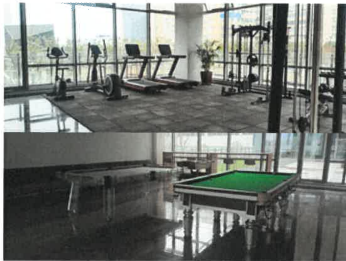
图4：德沃康健身房&德沃康台球室

公司工会开设乒乓球、羽毛球、篮球、电竞等多个俱乐部，同时在2023年公司新建立了健身房、书吧、趣味空间、电竞房等，在工作之余开展丰富的娱乐活动，一方面可以宣泄生活和工作中的压力，一方面又增强了体质、促进了同事间情谊。春节、元宵节、端午节、中秋节、父亲节、母亲节、妇女节等各种节假日为员工发放慰问礼品，在中国人民解放军建军96周年之际，为弘扬拥军优属的优良传统，公司组织开展“八一”建军节退役军人慰问活动，将公司的关心关爱传递至每位退役同事心间。