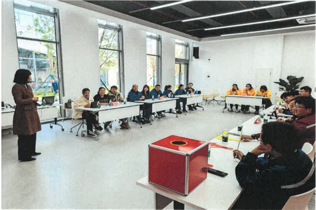
图10：安全知识竞赛活动